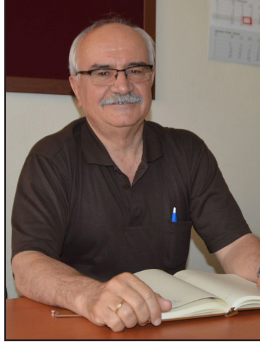
DOĞRU İŞ YAPARSA, 1 YIL SONRA EMEĞİNİN KARŞILIĞINI ALIR"

Açar, sözlerini şöyle tamamladı: "Yeni üretim sezonu başlıyor. Üreticilerimiz yeni beyannamelerini verirken, dikkat etmelerinde fayda var. Bu sezonda hangi üretici doğru iş yaparsa, 1 yıl sonra emeğinin karşılığını alır."