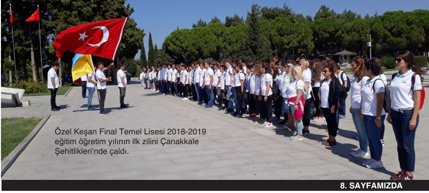
Özel Keşan Final Temel Lisesi 2018-2019 eğitim öğretim yılının ilk zilini Çanakkale Şehitlikleri'nde çaldı.