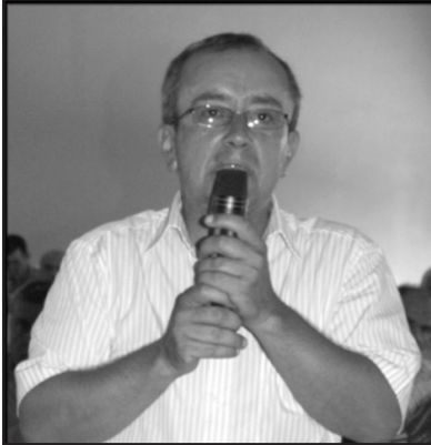
ri yağmur yağmasını diye dua ediyor."