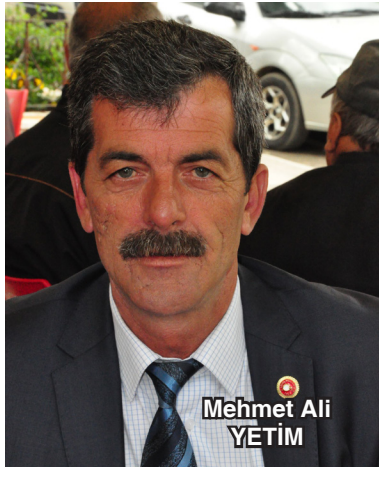
mesajlarda yapıcı bir şeyler yok."

Yetim sözlerine şöyle devam etti: "Biz Keşan'ın gelir düzeyinin artmasını ve insanların para kazanmasını istiyoruz. Bundan ötürü Keşan'daki OSB'nin kurulması için söyleme değil, icraata geçilmesi gerekiyor. Bu iş Uzunköprü Ticaret ve Sanayi Odası'nın girişimiyle oluyorsa, Keşan Ticaret ve Sanayi Odası ile AKP Keşan İlçe yönetimi bu işin neresindedir? Uzunköprü'de birlik ve beraberlik içerisinde yapılan çalışmalar neticesinde, OSB'de ciddi bir ilerleme kat edildi. Keşan'da bu konuda atılan hiçbir adım yok. Kimenin bu konuda, taşın altına elini koyduğunu görmüyorum. Burada amacım eleştirmek değil. Ancak hükümet yetkilileri tarafından yapılan bir çalışma yok. Bakanlar, AKP'nin ilçe kongrelerine geliyorlar, ilçe başkanının kim olacağına karar veriliyor ve mesajlar veriliyor. Ama