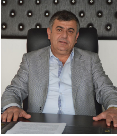
Saat:15.30 Gökçetepe Köyü Bizlere destek veren bilim insanlarımıza şimdiden teşekkür ediyoruz."

Saat:11.30 Çamlıca Saat:13.00 Sazlıdere Saat:14.00 Sazlıdere sahil ve liman yeri